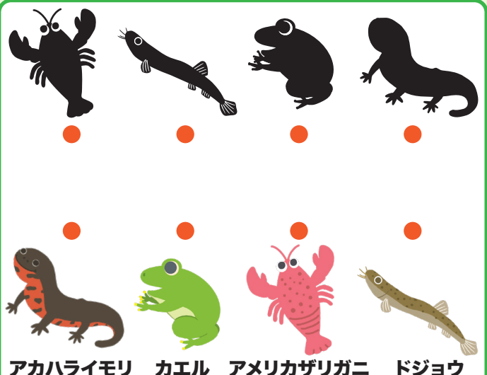
アカハライモリ カエル アメリカザリガニ ドジョウ