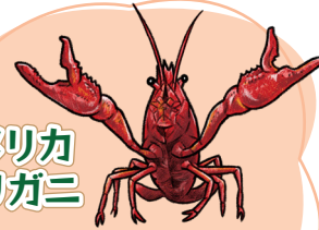
アメリカ ザリガニ